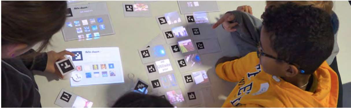
FIGURE 1 – CARDS est un système de réalité mixte destiné à l'apprentissage collaboratif en contexte scolaire, où le contenu physique et numérique est manipulé par plusieurs utilisateurs dans un espace de travail.

Les trois cycles itératifs ont chacun suivi un modèle de conception itératif, où à partir de retours utilisateurs et de données issues de la littérature, des fonctionnalités et interactions étaient développées, puis présentées aux élèves et professeurs pour une évaluation en contexte scolaire. Pour les cycles itératifs 2 et 3, un protocole expérimental a été défini, déterminant l'activité à réaliser, le nombre d'élèves par groupe et les données collectées, y compris les questionnaires et les enregistrements vidéo pour les évaluations futures.